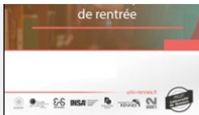
Projet Université de Rennes : La rentrée universitaire 20202021