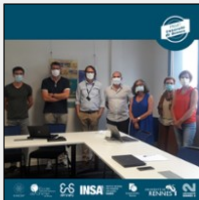
Projet Université de Rennes : Mise en place d'un conseil d'appui scientifique et sanitaire