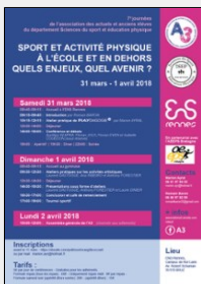
Journées de l'A3 2018